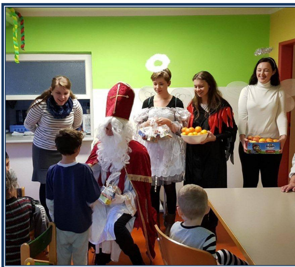
Mikuláš v Prešove