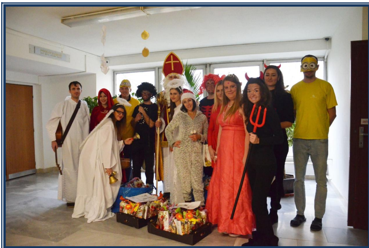
Mikuláš v Bratislave

Úsmev na tvárach detí nám bol dostatočnou odmenou za čas a tvrdú prácu, ktorú sme do tejto akcie vložili. ☺