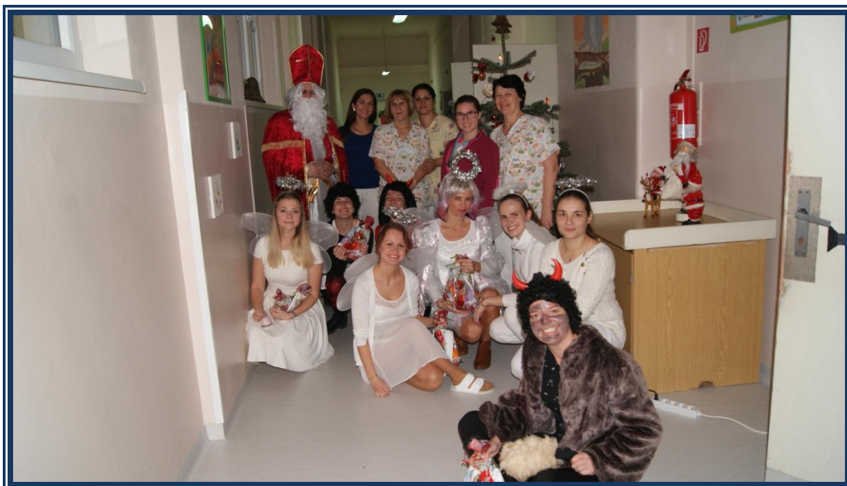
Mikuláš v Trnave